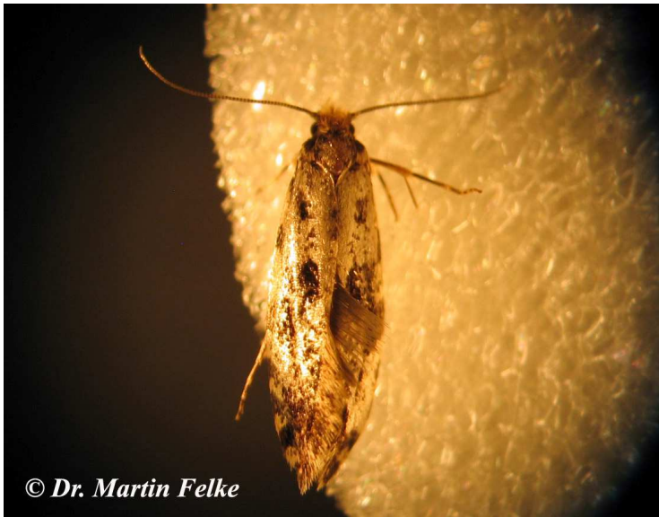
Abbildung 2: Die Antennen werden fast so lang wie der restliche Körper